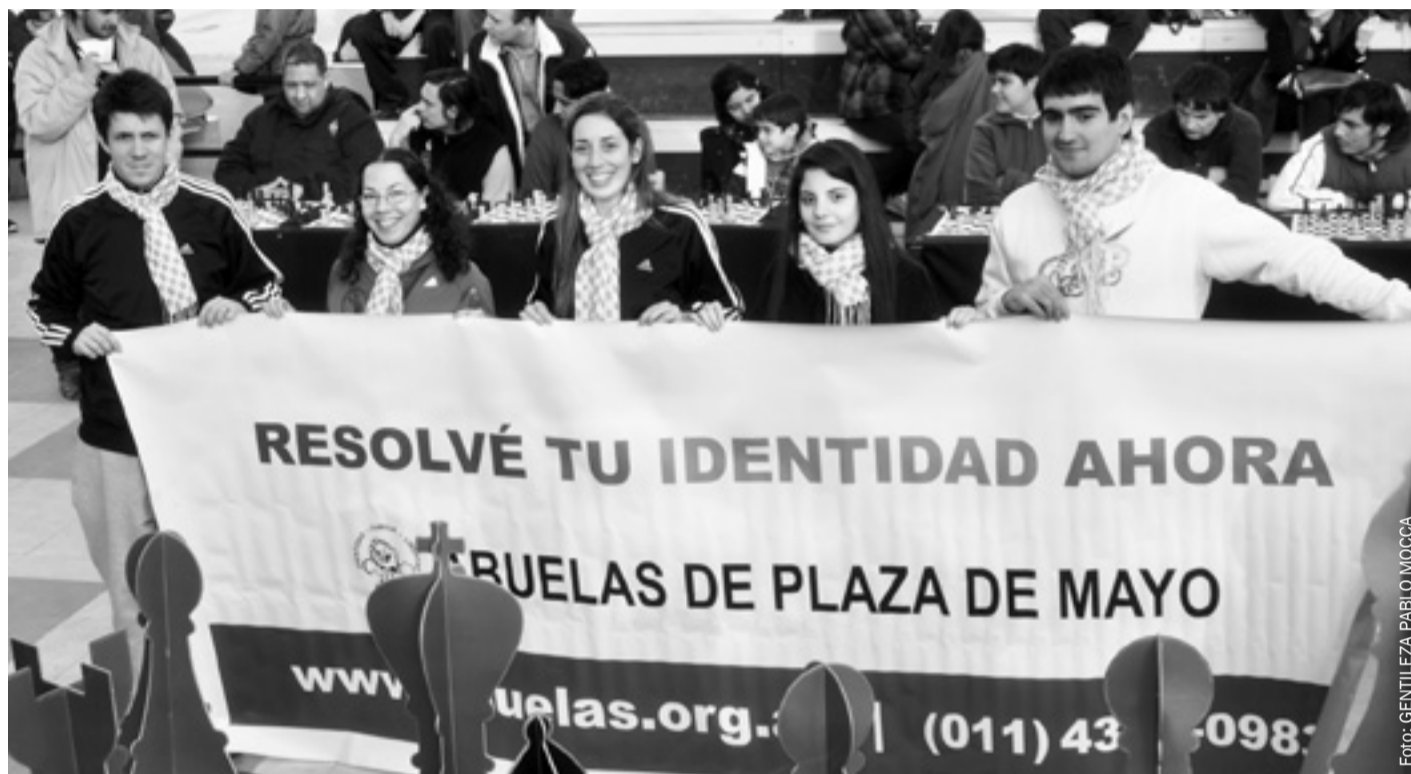
Los ajedrecistas olímpicos, solidarios con la Asociación.

Justo antes de partir a la 41 a Olimpiada en Tromso, Noruega, los integrantes del conjunto argentino posaron con una bandera convocando a los hombres y mujeres con dudas sobre su identidad.