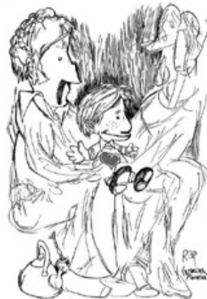
Los papeles desaparecidos se deslajan en la memoria... El hijo, cuando sea restituido a su familia verdadera, se dibujará completamente. Y sus papeles también.

Personalidades de todos los ámbitos manifestaron su alegría. Organismos nacionales e internacionales, incluida la ONU, hicieron llegar sus saludos a la Asociación y emitieron comunicados de beneplácito. El mandatario boliviano Evo Morales expresó: “Nuestro respeto y nuestro homenaje a la valentía, la consecuencia y el compromiso con la vida, que ha caracterizado a la lucha de las Abuelas”. “Qué milagro tan grande para las Abuelas de la Plaza de Mayo, felicitaciones a Estela desde Venezuela, la Justicia llega de la mano